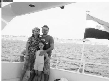
Мы любим быть вместе! Красное море, 2008