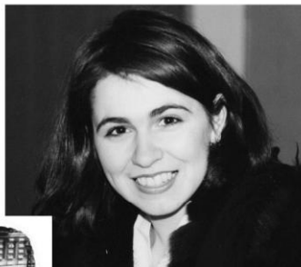
Уже со Святым Духом