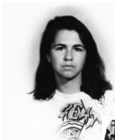
За год до крещения

Копирование и печать материалов только с письменного разрешения правообладателя. Дополнительная информация на www.mcoc.ru .